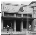
Rua c 0 São Leopoldo-RS Brasil Telefone